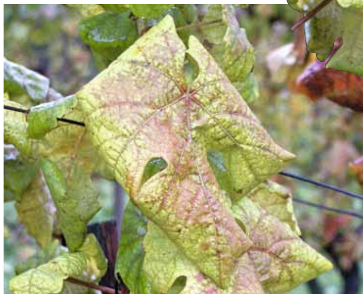
Die Schwarzholzkrankheit an der Weinrebe äußert sich zuerst durch Blätterverfärbungen.